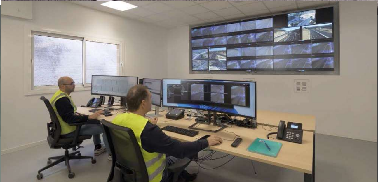
Salida de emergencia y pantallas del centro de control del túnel (debajo).

definición fijas para la detección automática de incidentes (DAI) y cámaras Domo en las galerías de evacuación y cerca de las bocas. El equipamiento lo completan pórticos para control de gálibo, barreras de control de acceso, aforadores, postes SOS cada 150 metros y sistemas de megafonía y de radiocomunicaciones.