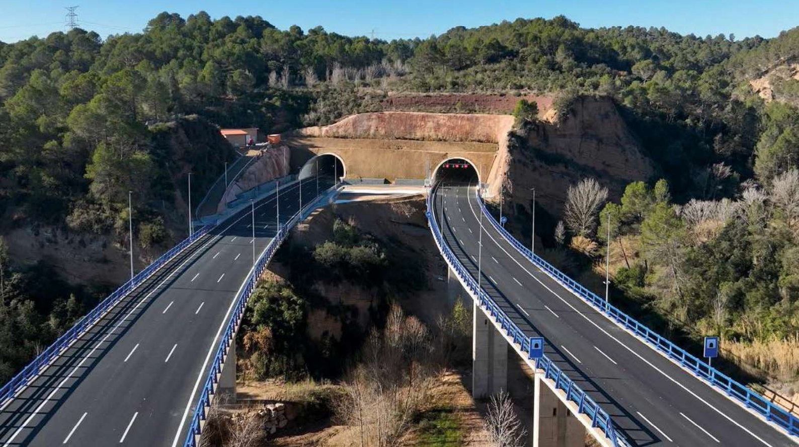
Boca este del túnel de Voltrera y viaducto sobre la riera de Sant Jaume.

Este cúmulo de circunstancias adversas ha tenido su reflejo en el presupuesto de ejecución de obra, cuyo importe ha ascendido a 269 M€ (IVA incluido). La inversión global del ministerio en el tramo ha sido de 293 M€ (IVA incluido), una vez sumados también los importes correspondientes a las expropiaciones, la redacción de proyectos y de control y vigilancia de la obra y el patrimonio cultural. Se trata de una de las mayores inversiones del ministerio en materia de carreteras en la comunidad autónoma catalana. La actuación, dirigida por la Demarcación de Carreteras del Estado en Cataluña, ha sido ejecutada por la UTE B-40 (Acciona Infraestructuras, Comsa y Copisa), mientras que el control y vigilancia de la obra ha corrido a cargo de TPF Ingeniería.