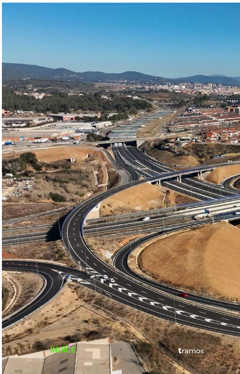
Enlace de Viladecavalls con la C-16. Al fondo, la ciudad de Terrassa.

autovía orbital, resuelto mediante ramales directos, lazos y un ramal tipo círculo para el movimiento Sabadell-Olesa; enlace 5, en la zona de Can Trías, en el extremo este de las vías colectoras; enlace 3, con la carretera de Castellbell (C-58), formado por dos ramales principales de conexión incluyendo