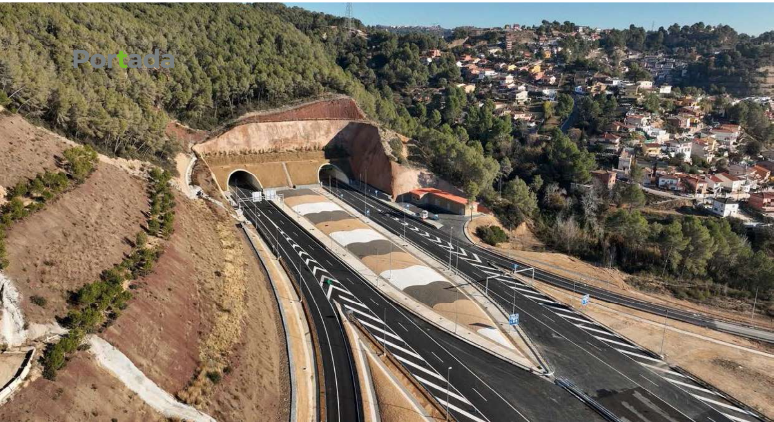
Boca oeste y edificio del centro de control del túnel.

viales necesarios de los distintos enlaces. En la zona central destacan por su longitud el viaducto sobre la riera de Gaià, con cinco vanos y dos tableros gemelos de 228,8 metros de longitud cada uno, y el viaducto sobre la riera de Sant Jaume, constituido por dos table-